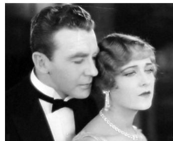
1927 SUPPLICE DE FEMME (The Siren) de Byron Haskin avec Tom Moore