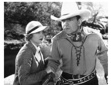
1934 QUAND UN HOMME VOIT ROUGE (When a Man sees red) d'A. James avec Buck Jones