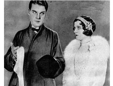
1925 LE MARIAGE ROMANESQUE (When Husbands flirt) de W. Wellman avec F. Stanley