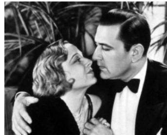
1932 THE WIDOW IN SCARLET de George B. Seitz avec Kenneth Harlan