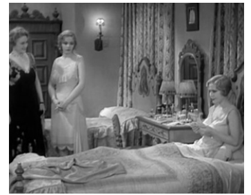
1929 RELATIONS DE VACANCES (Tanned Legs) de Marshall Neilan avec June Clyde