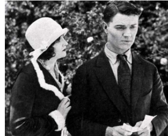
1925 THE DANGER SIGNAL d'Erle C. Kenton avec Gaston Glass