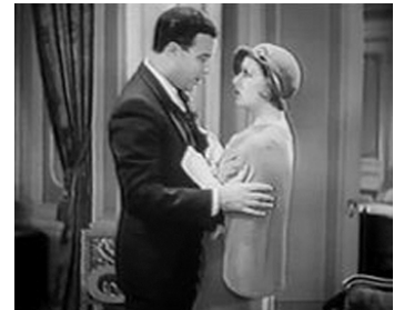
1932 THE KING MURDER CASE de Richard Thorpe avec Robert Frazier