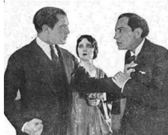
1924 DANGEROUS PLEASURE d'Harry Revier avec Sheldon Lewis, Theodore Lutsch