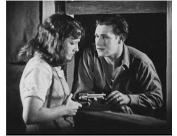
1924 THE COWBOY AND THE FLAPPER d'Alan James avec Morgan Davis