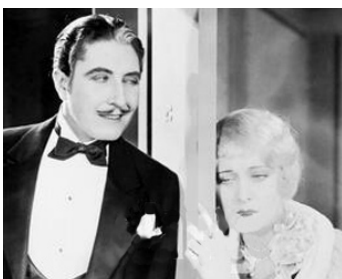
1928 MÉFIEZ-VOUS DES BLONDES (Beware of Blondes) de George B. Seitz avec Matt Moore