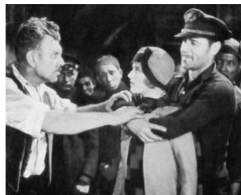
1927 L'ESCALIER DES CENT MARCHES (The Warning) de G. Seitz avec P. Harmon, Jack Holt