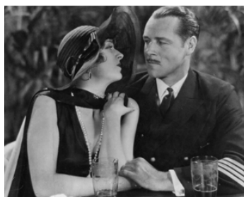
1928 L'ÉPAVE VIVANTE (Submarine) de Frank Capra avec Ralph Graves