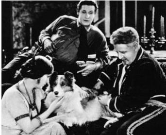
1924 MAN FROM GOD'S COUNTRY d'Alan James avec William Fairbanks