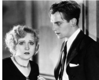
1930 THE WAY OF ALL MEN de Frank Lloyd avec Douglas Fairbanks Jr