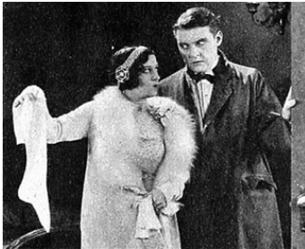
1925 THE FATE OF A FLIRT de Frank R. Strayer avec Forrest Stanley