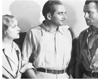
1929 VENGEANCE (Vengeance) d'Archie Mayo avec Jack Holt, Philip Strange