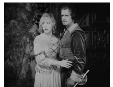
1928 LE MASQUE DE FER (The Iron Mask) d'Allan Dwan avec Douglas Fairbanks Sr