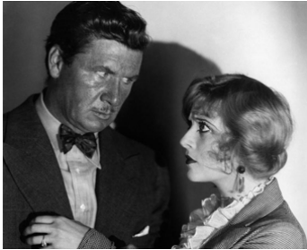
1929 FORCE (The Mighty) de John Cromwell avec George Bancroft