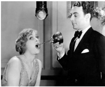
1929 L'AFFAIRE DONOVAN (The Donovan Affair) de Frank Capra avec William Collier