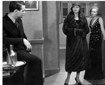
1932 CABARET DE NUIT (Night World) d'Hobart Henley avec Lew Ayres, Hedda Hopper