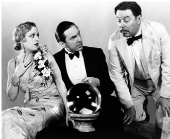
1932 LE CHAMEAU NOIR (The black Camel) d'H. MacFadden avec Bela Lugosi, W. Oland