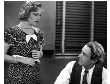
1931 ANYBODY'S BLONDE de Frank R. Strayer avec Henry B. Walthall