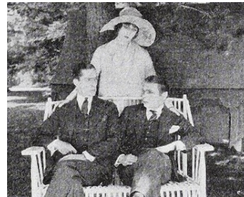
1926 WHEN THE WIFE'S AWAY de Frank R. Strayer avec George K. Arthur, Ned Sparks