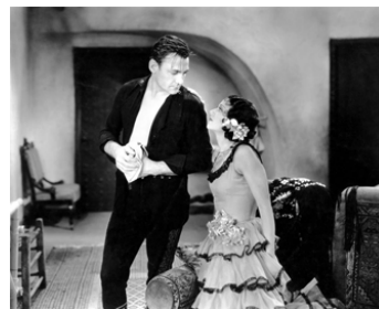
1933 JOHN L'INVINCIBLE (The Fighting Ranger) de George B. Seitz avec Buck Jones