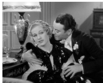
1933 COURT-CIRCUIT (By Candlelight) de James Whale avec Niels Asther