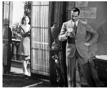
1929 MON PAPA (Father and Son) d'Erle C. Kenton avec Jack Holt