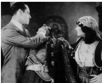
1927 WANDA LA GITANE (The Tigress) de George B. Seitz avec Jack Holt