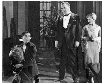
1926 LA FEMME DE MON MARI (Poker Faces) d'Harry A. Pollard avec E.E. Horton, T. O'Brien