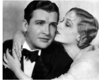
1930 MEURTRE SUR LE TOIT (Murder on the Roof) de George B. Seitz avec David Newell