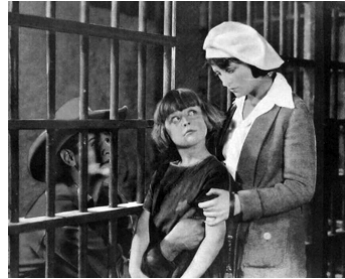
1924 CALL OF THE MATE d'Alan James avec William Fairbanks