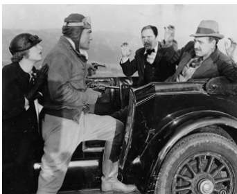
1933 LE CHASSEUR INTRÉPIDÉ (The Thrill Hunter) de G. B. Seitz avec R. Ellis, B. Jones