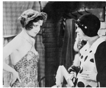
1929 LA DANSE DE LA VIE (The Dance of Life) d'A. Edward Sutherland avec Nancy Carroll