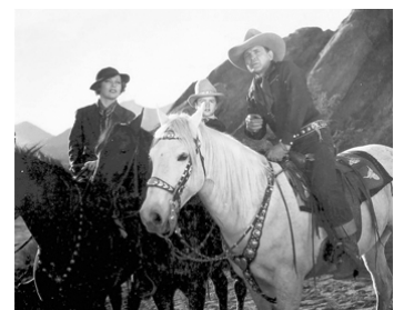
1936 THE COWBOY AND THE KID de Ray Taylor avec Bill Burrud, Buck Jones